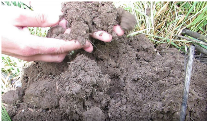
El suelo bien agregado permite una infiltración de agua eficiente, lo que brinda mejor habilidad para lixiviar sales debajo del nivel de las raíces.

El estrés en forma de salinidad es el factor ambiental más limitante que afecta el crecimiento de las plantas en regiones donde las precipitaciones son limitadas (Parida y Das, 2005). Las sales limitan el crecimiento de las plantas a través de varios caminos. Primero, los suelos salinos reducen la capacidad de absorber agua. "Síntomas de estrés osmótico son muy similares a los del estrés por sequía, e incluyen retraso en el crecimiento, mala germinación, hojas quemadas, marchitamiento y posiblemente muerte" (McCauley y Jones, 2005). Estos síntomas, similares al estrés de sequía, ocurren incluso cuando hay agua en el suelo. Además de afectar la capacidad de una planta para tomar agua, el exceso de salinidad puede afectar la disponibilidad y absorción de nutrientes, y puede causar problemas de toxicidad de sodio y cloro (Evelin et al., 2009). Los efectos que tiene la sal en las plantas varían según el tipo de cultivo, la cantidad de sal, y los tipos de sales en el suelo. La presencia de sales