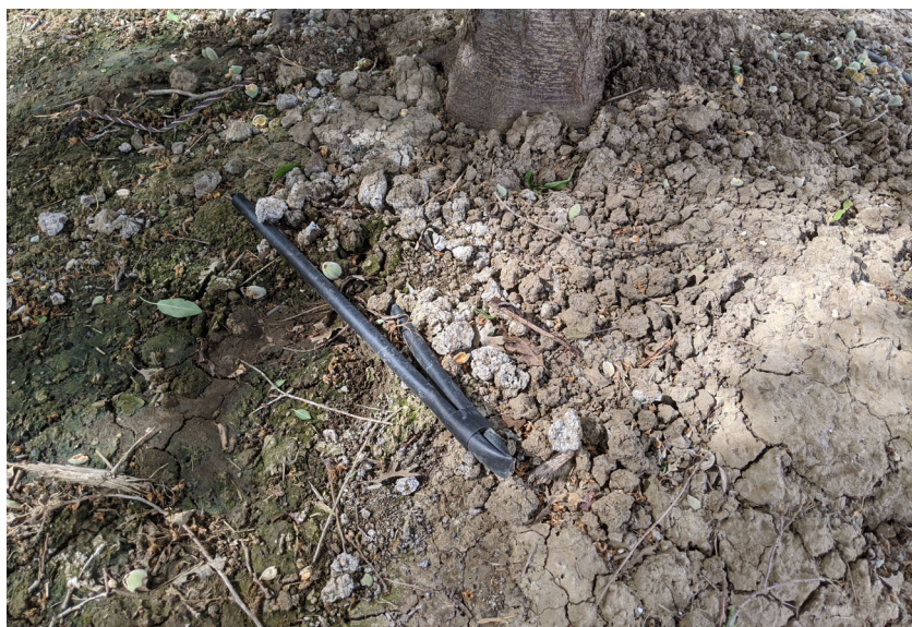
El suelo descubierto, expuesto tanto al sol como al viento, pierde humedad más rápidamente que suelo cubierto con mantillo. El agua se evapora dejando una costra de sales.

Los hongos micorrízicos arbusculares representan un gran grupo de hongos simbióticos que forman relaciones con más del 80% de todas las plantas (Kumar et al., 2019). Estos hongos han probado ser remediadores eficaces del suelo y promotores del crecimiento de las plantas. En suelos salinos ayudan a las plantas a mejorar la absorción de agua, la absorción de nutrientes, aumento de fotosíntesis, y adaptación a estrés oxidativo (Kumar et al., 2019). Se pueden comprar comercialmente o