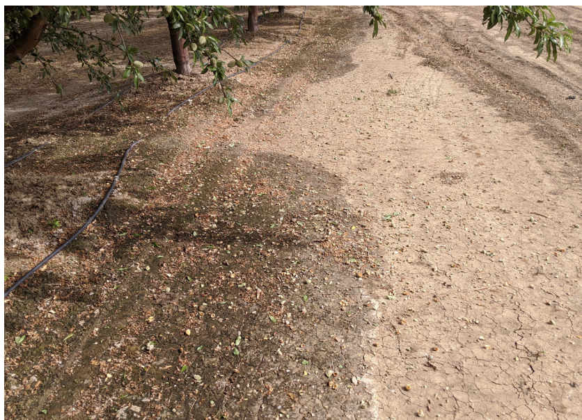
El borde entre el suelo húmedo y el suelo seco comienza a demostrar evidencia de sales acumuladas. Observe la raya de color blanco.