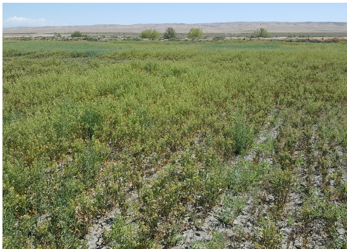
Suelo salino bajo riego plantado con 12 especies de cultivos de cobertura. Solo emergieron unas mostazas atrofiadas y malezas. Este suelo tiene una conductividad eléctrica de 13.

El Servicio Nacional de Información de la Agricultura Sostenible de ATTRA es administrado por el Centro Nacional para la Tecnología Apropiada (NCAT) y financiado por una subvención del Servicio de Negocios y Cooperativas Rurales del USDA. Visite el sitio Web de NCAT (en inglés: www.ncat.org agriculture) para más información sobre nuestros proyectos en la agricultura sostenible.