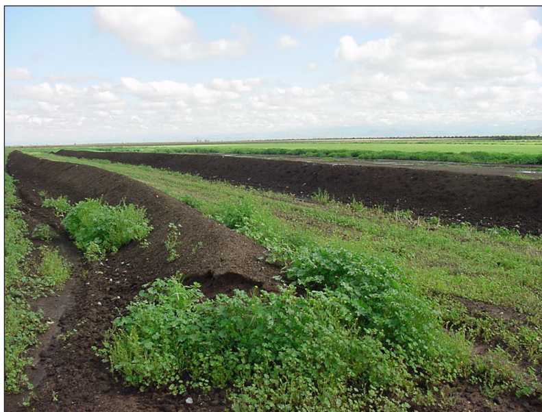
El estiércol compostado tiene muchos beneficios para los suelos, pero los suelos deben ser monitoreados para la salinidad si hay aplicaciones repetidas de este tipo de compost.

Evite agregar estiércol crudo o compostado a campos con cultivos que son muy sensibles a la sal, especialmente al estiércol de vaca lechera, que suele ser más alto en contenido de sal (Lloyd et al., 2016). En estiércol bien compostado o envejecido, las cargas de sal serán mucho más bajas que en el estiércol fresco, y se puede agregar en caso por caso. La prueba de estas enmiendas para el contenido de sal es recomendado antes de la aplicación.