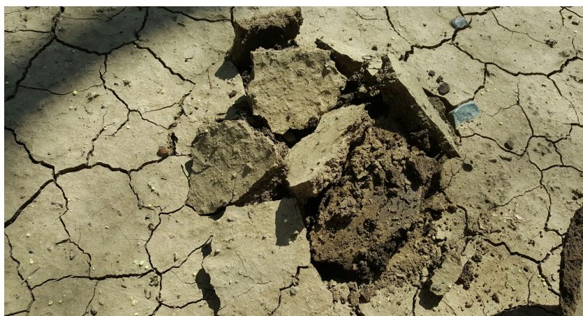
Formación de costras en la superficie como resultado de una estructura deficiente del suelo. La costra evita la infiltración del agua y el aire.

en las capas superficiales tiene un impacto mayor comparado con la presencia de sales más profundas, debido a su proximidad a las raíces.